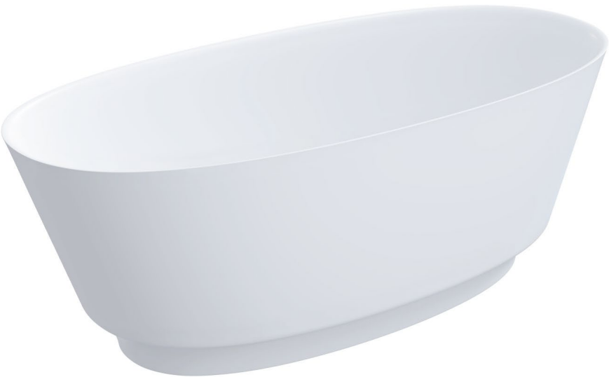
Wanna wolnostojąca, 158 x 72 cm