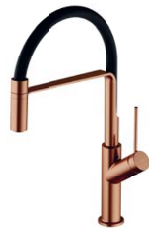
Miedź szczotkowana PVD / czarny mat VI6350BLCPB bateria kuchenna z wyciąganą wylewką