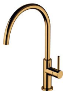
Złoty połysk PVD Y1251GL bateria kuchenna