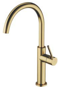
Mosiądz szczotkowany PVD TL6050BSB bateria kuchenna