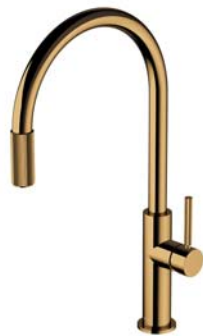
Złoty połysk PVD SW9057-FD1GL bateria kuchenna z zestawem filtrującym SW9057GL bateria kuchenna do podłączenia zestawu filtrującego