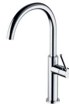
Chrom połysk TL6050CR bateria kuchenna