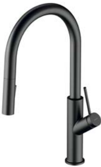
Grafit szczotkowany BE6455GR bateria kuchenna z wyciąganą wylewką