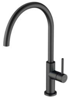
Grafit szczotkowany Y1251GR bateria kuchenna