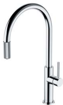
Chrom połysk SW9057-FD1CR bateria kuchenna z zestawem filtrującym SW9057CR bateria kuchenna do podłączenia zestawu filtrującego