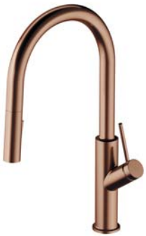
Miedź szczotkowana PVD BE6455CPB bateria kuchenna z wyciąganą wylewką