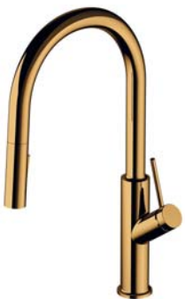
Złoty połysk PVD BE6455GL bateria kuchenna z wyciąganą wylewką