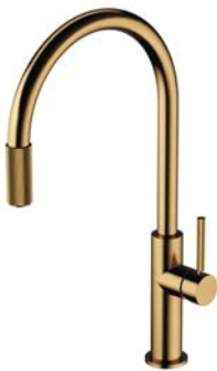
Złoty szczotkowany PVD SW9057-FD1GLB bateria kuchenna z zestawem filtrującym SW9057GLB bateria kuchenna do podłączenia zestawu filtrującego