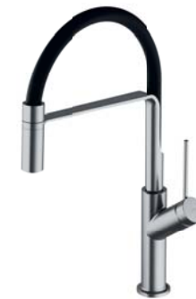
Nikiel szczotkowany PVD / czarny mat VI6350BLNI bateria kuchenna z wyciąganą wylewką