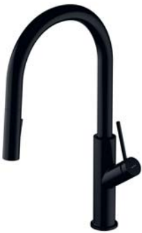
Czarny półmat BE6455BL bateria kuchenna z wyciąganą wylewką