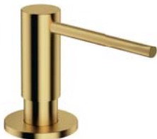
Mosiądz szczotkowany PVD MP60723BSB dozownik mydła w płynie, nablatowy