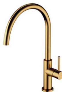
Złoty szczotkowany PVD Y1251GLB bateria kuchenna