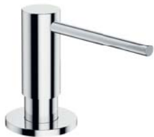
Chrom połysk MP60723CR dozownik mydła w płynie, nablátowy