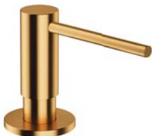
Złoty szczotkowany PVD MP60723GLB dozownik mydła w płynie, nablatowy