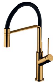
Złoty połysk PVD / czarny mat VI6350BLGL bateria kuchenna z wyciąganą wylewką