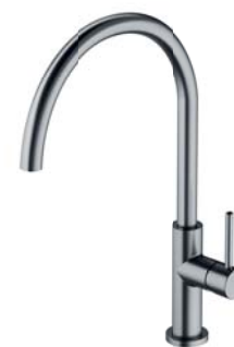
Nikiel szczotkowany PVD Y1251NI bateria kuchenna