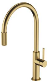
Mosiądz szczotkowany PVD SW9057-FD1BSB bateria kuchenna z zestawem filtrującym SW9057BSB bateria kuchenna do podłączenia zestawu filtrującego