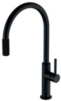
Czarny mat SW9057-FD1BL bateria kuchenna z zestawem filtrującym SW9057BL bateria kuchenna do podłączenia zestawu filtrującego