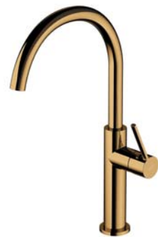
Złoty połysk PVD TL6050GL bateria kuchenna