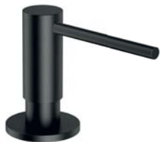
Grafit szczotkowany MP60723GR dozownik mydła w płynie, nablátowy