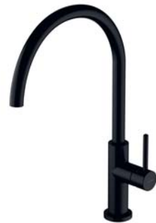
Czarny półmat Y1251BL bateria kuchenna