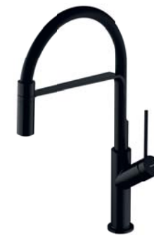
Czarny półmat VI6350BLBL bateria kuchenna z wyciąganą wylewką