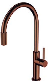
Miedź antyczna szczotkowana SW9057-FD1ORB bateria kuchenna z zestawem filtrującym SW9057ORB bateria kuchenna do podłączenia zestawu filtrującego