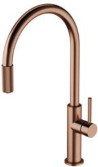
Miedź szczotkowana PVD SW9057-FD1CPB bateria kuchenna z zestawem filtrującym SW9057CPB bateria kuchenna do podłączenia zestawu filtrującego