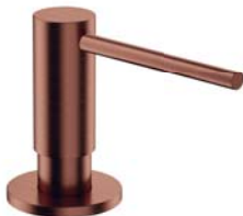
Miedź antyczna szczotkowana MP60723ORB dozownik mydła w płynie, nablatowy