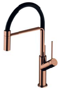
Miedź połysk PVD / czarny mat VI6350BLCP bateria kuchenna z wyciąganą wylewką