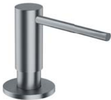
Nikiel szczotkowany PVD MP60723NI dozownik mydła w płynie, nablátowy