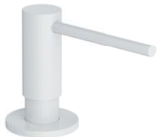
Biały mat MP60723WM dozownik mydła w płynie, nablatowy