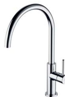
Chrom połysk Y1251CR bateria kuchenna