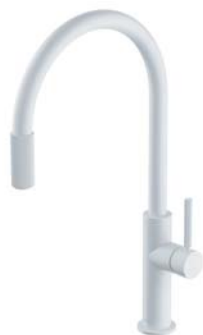
Biały mat SW9057-FD1WM bateria kuchenna z zestawem filtrującym SW9057WM bateria kuchenna do podłączenia zestawu filtrującego