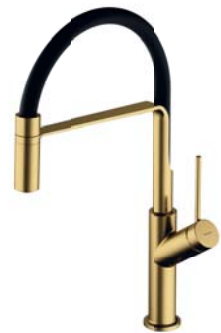
Mosiądz szczotkowany PVD / czarny mat VI6350BLBSB bateria kuchenna z wyciąganą wylewką