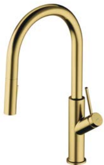
Mosiądz szczotkowany PVD BE6455BSB bateria kuchenna z wyciąganą wylewką