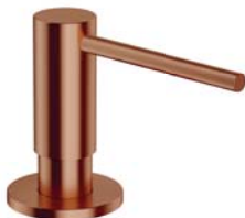
Miedź szczotkowana PVD MP60723CPB dozownik mydła w płynie, nablatowy