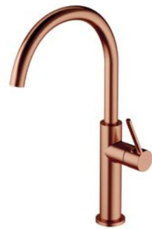
Miedź szczotkowana PVD TL6050CPB bateria kuchenna