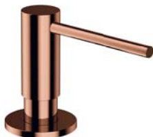
Miedź połysk PVD MP60723CP dozownik mydła w płynie, nablatowy