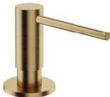
Brąz antyczny szczotkowany MP60723BR dozownik mydła w płynie, nablatowy