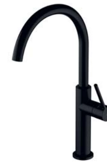
Czarny półmat TL6050BL bateria kuchenna