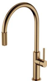
Brąz antyczny szczotkowany SW9057-FD1BR bateria kuchenna z zestawem filtrującym SW9057BR bateria kuchenna do podłączenia zestawu filtrującego