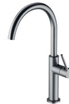
Nikiel szczotkowany PVD TL6050NI bateria kuchenna