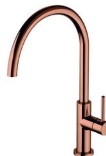
Miedź połysk PVD Y1251CP bateria kuchenna