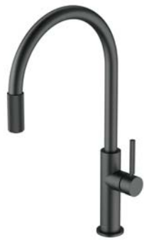
Grafit szczotkowany SW9057-FD1GR bateria kuchenna z zestawem filtrującym SW9057GR bateria kuchenna do podłączenia zestawu filtrującego