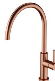
Miedź szczotkowana PVD Y1251CPB bateria kuchenna