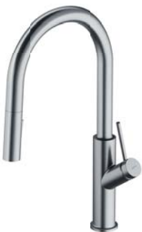
Nikiel szczotkowany PVD BE6455NI bateria kuchenna z wyciąganą wylewką