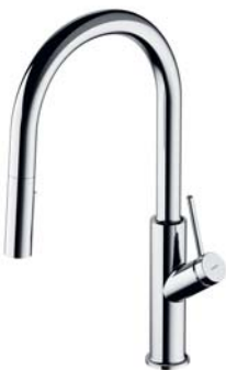
Chrom połysk BE6455CR bateria kuchenna z wyciąganą wylewką