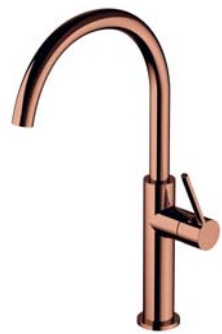
Miedź połysk PVD TL6050CP bateria kuchenna