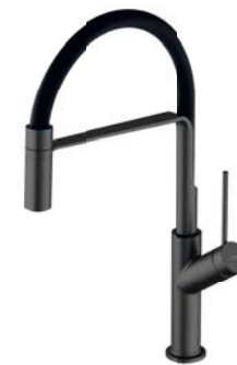
Grafit szczotkowany / czarny mat VI6350BLGR bateria kuchenna z wyciąganą wylewką