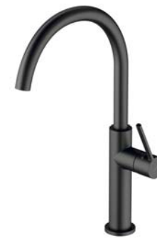
Grafit szczotkowany TL6050GR bateria kuchenna