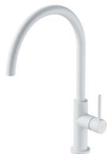
Biały mat Y1251WM bateria kuchenna