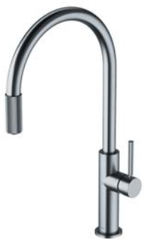
Nikiel szczotkowany PVD SW9057-FD1NI bateria kuchenna z zestawem filtrującym SW9057NI bateria kuchenna do podłączenia zestawu filtrującego