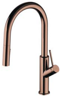
Miedź połysk PVD BE6455CP bateria kuchenna z wyciąganą wylewką