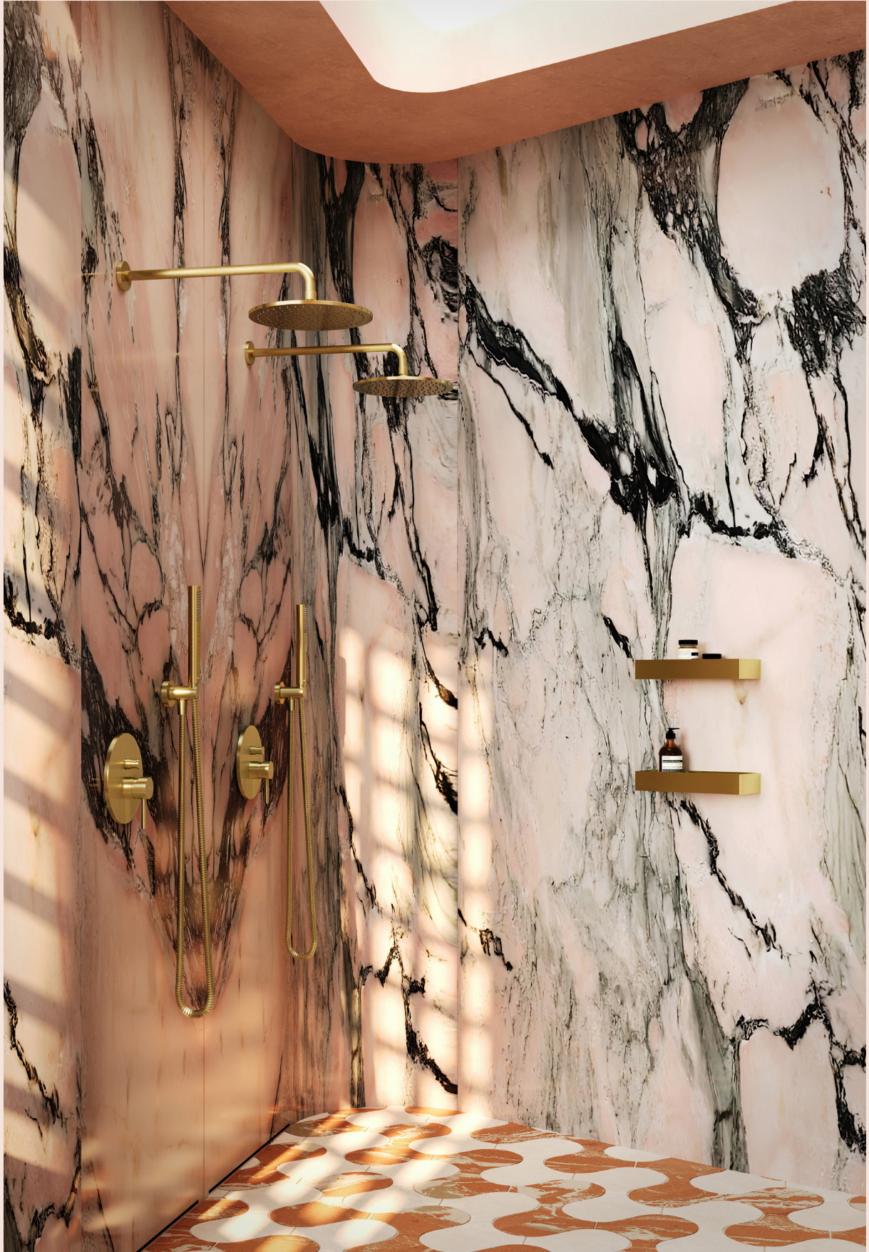
Y armatura łazienkowa | UNI akcesoria łazienkowe