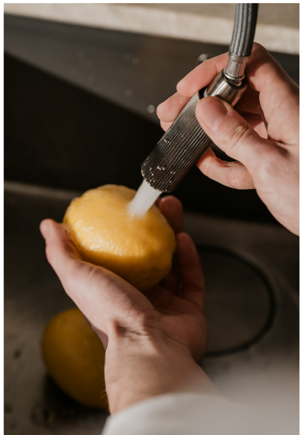
OMNIRE SWITCH | Bateria kuchenna z zestawem filtrującym