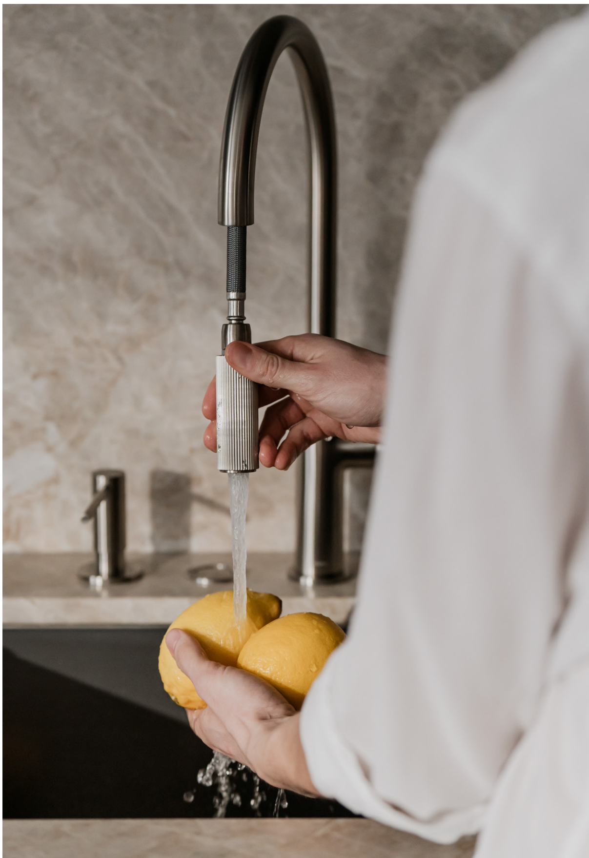
SWITCH | Wyciągana wylewka podnosi komfort użytkowania kuchni

OMNIRE SWITCH | Bateria kuchenna z zestawem filtrującym