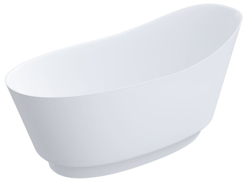
Wanna wolnostojąca, 158 x 72 cm